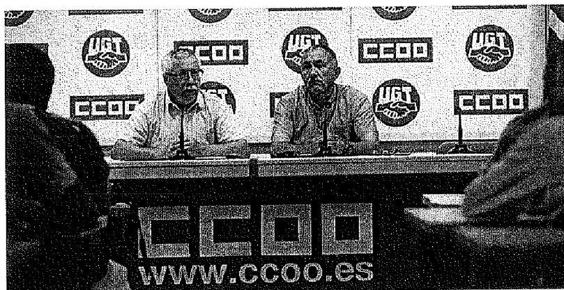
Ignacio Fernández Toxo, secretario general de Comisiones Obreras, y Josep María Álvarez, líder de UGT.

Los sindicatos exigen a los grupos políticos llegar a acuerdos para evitar la celebración de nuevas elecciones e instan al Parlamento a revalorizar los salarios públicos, las pensiones y el salario mínimo interprofesional. Ignacio Fernández Toxo, secretario general de Comisiones Obreras, y Josep María Álvarez, líder de UGT, han comparecido en rueda de prensa tras la reunión de ambas delegaciones para valorar la situación política, analizar las prioridades del movimiento sindical y criticar la situación de "parálisis" e "incertidumbre política". Ambos rechazan la hipótesis de unas terceras elecciones puesto que consideran que supondría un fracaso de la acción política "con el consiguiente descrédito ante la ciudadanía". Además, insisten en que existen "fórmulas alternativas" al Gobierno del PP aunque han evitado referirse a ellas. "No nos corresponde a nosotros porque perderíamos autonomía de futuro y por lo tanto es una posición abierta al conjunto de las fuerzas políticas", ha defendido Álvarez.