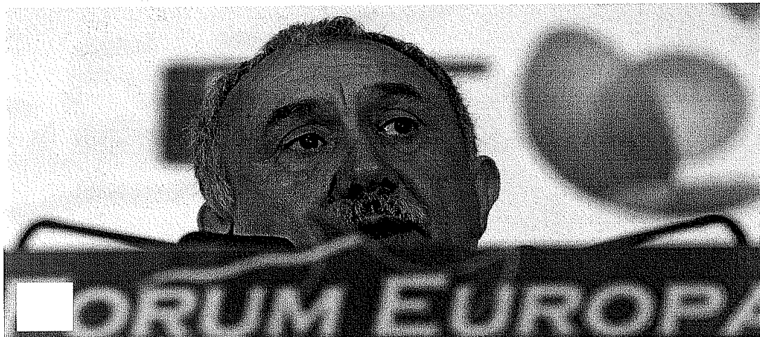
El secretario general de UGT, José María Álvarez.

UGT y CC OO han mostrado este lunes su rechazo a la hipótesis de unas terceras elecciones y han acordado las prioridades del movimiento sindical. Así lo han asegurado los secretarios generales de ambos sindicatos, José María Álvarez (UGT) e Ignacio Fernández Toxo (CC OO) , que consideran "profundamente negativa" la situación de parálisis e incertidumbre política actual. Han defendido asimismo la necesidad de dialogar y pactar, así como un documento de 20 actuaciones urgentes para el progreso y el bienestar social. Entre las medidas propuestas están aprobar un plan de choque estatal por el empleo, derogar las dos últimas reformas laborales, revalorizar las pensiones y reformular la Constitución para configurar un Estado federal .